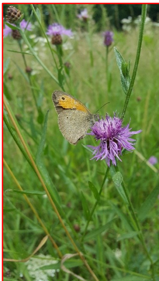
Ochsenauge Wiesenflockenblume

Das 2012 in Frankfurt am Main gegründete Bündnis „Kommunen für biologische Vielfalt“ (Kommbio) ist das größte deutsche Netzwerk für naturnahe Kommunen und stärkt die Bedeutung von Natur im unmittelbaren Lebensumfeld der Menschen. Ein attraktives und insektenfreundliches Stadtgrün trägt zur Biodiversität und Artenvielfalt bei, stiftet Identität und belebt die Innenstädte. Das hat auch viele Vorteile für die Klimaanpassung und den Klimaschutz.