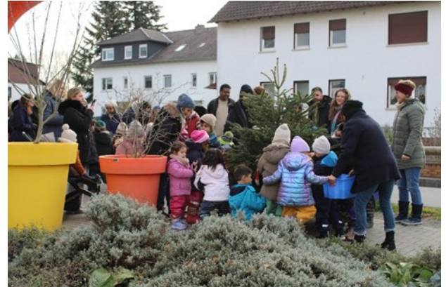
Foto: Gemeinsames Baumschmücken in der Riedbahn, ein niedrigschwelliges Begegnungsformat zur Stärkung von Nachbarschaft und Zusammenhalt

Eine besondere Herausforderung für die GWA ist die geringe soziale Infrastruktur im Quartier.