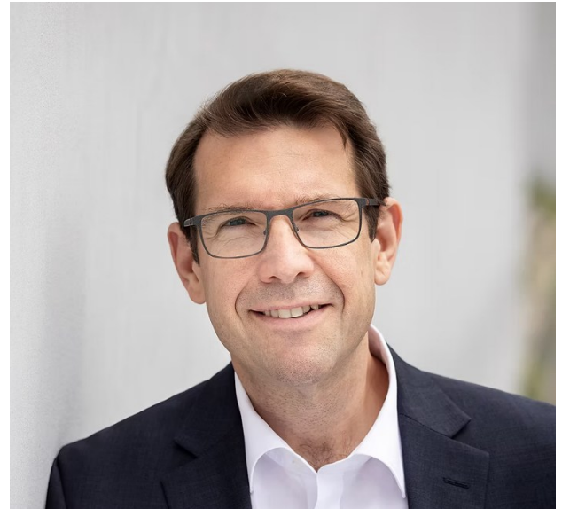
Foto: Hanno Benz, SGK Landesvorsitzender Hessen, © Sandra Kühnapfel

Doch die kommunale Selbstverwaltung steht unter Druck. Finanzielle Engpässe lähmen die Gestaltungskraft vor Ort und frustrieren diejenigen, die sich engagieren. Diese Schwäche nutzen Populisten aus, die Ängste schüren und Misstrauen säen. Deshalb braucht es Kommunalpolitikerinnen und Kommunalpolitiker, die gemeinsam Haltung zeigen: für Demokratie und Toleranz, gegen Hass und Hetze. Auch brauchen die Kommunen wieder die finanziellen Mittel, um ihre Ideen und