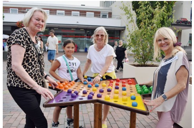
Foto: Groß und Klein kommen auf dem Baunataler Marktplatz zu „City spielt!“ zusammen

gramm der insgesamt sechs Events und die allgemeine Resonanz zeigen, dass dieser Plan voll und ganz aufgegangen ist.